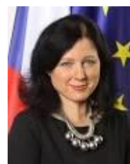
Vera Jourova, Comisaria de Justicia, Consumidores e Igualdad de Género

La Comisaria de Justicia, Vera Jourova, ha anunciado que desde el pasado 11 de enero, las víctimas de violencia (especialmente aquellas que hayan sufrido violencia doméstica o sido objeto de acoso) podrán asegurarse una mejor protección en cualquier Estado miembro de la UE. El Reglamento relativo al reconocimiento mutuo de las medidas de protección en materia civil recibió el respaldo del Parlamento Europeo en mayo de 2013 y de los ministros reunidos en Consejo de Justicia en junio de 2013 para completar la Directiva sobre la orden europea de protección adoptada en diciembre de 2011. Las nuevas normas implican el rápido y fácil reconocimiento en toda la UE, merced a un simple procedimiento de certificación, de las órdenes de alejamiento, protección y restricción emitidas en un Estado miembro. A partir de ahora, cualquier ciudadano que haya sufrido violencia doméstica podrá viajar y salir de su país en toda seguridad mediante una simple transferencia de la orden que le protege de su agresor. Hasta ahora, las víctimas debían seguir complejos procedimientos para conseguir el reconocimiento de sus medidas de protección en otros Estados miembros de la UE. Gracias a la mejora del reconocimiento de las órdenes de protección en cualquier Estado miembro de la UE se espera mejorar la libre circulación de las víctimas de la violencia. Ambos instrumentos han entrado en vigor el 11 de enero de 2015.